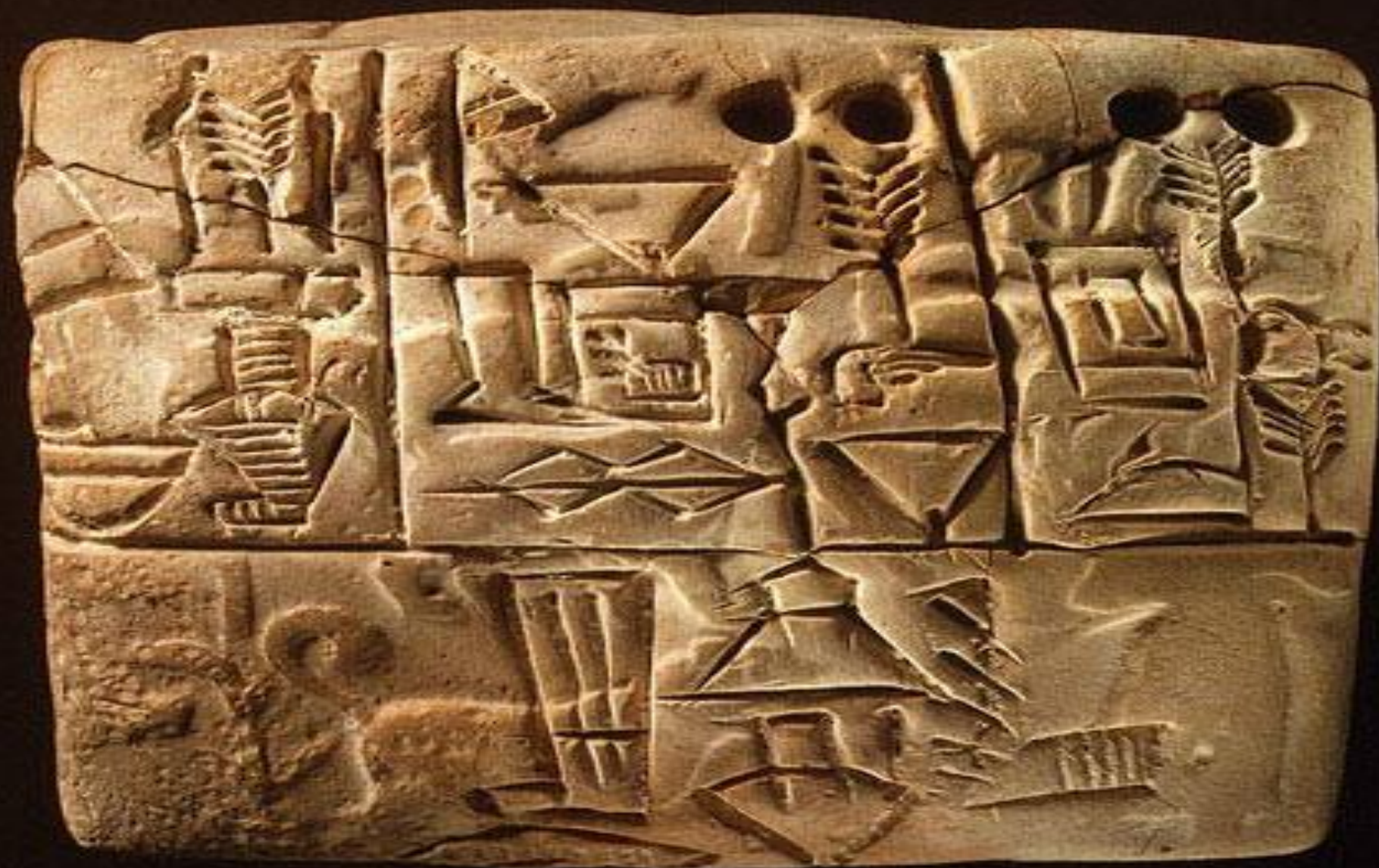
Administrative tablet with cylinder seal impression of a male figure, hunting dogs, and boars, Jamdat Nasr, Uruk III style.; 3100-2900 B.C.